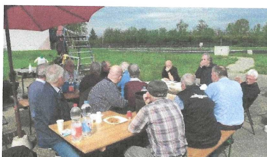
VIKING – GV 22.April 2023